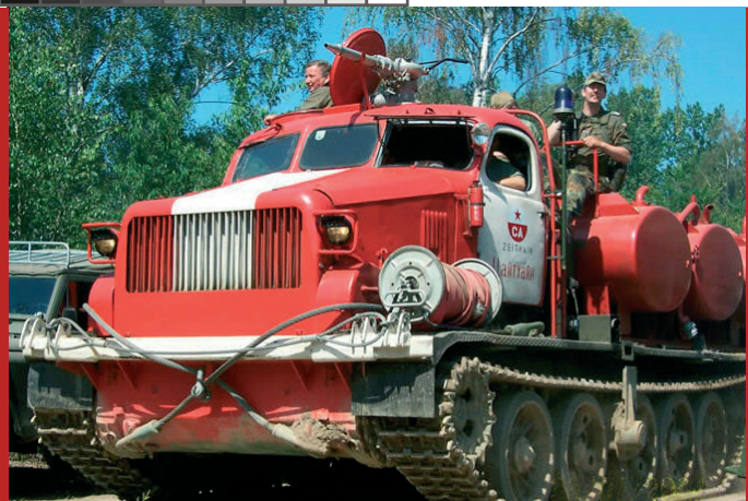
Mit dabei: der russische BAT Tanklöschpanzer Bj. 1962. Von diesem gewaltigen Exponat mit seinen 10.000 Liter Wasser-tanks existiert deutschlandweit nur noch dieser eine.